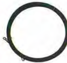
ฟิชเทปแบบเปลือย "F"