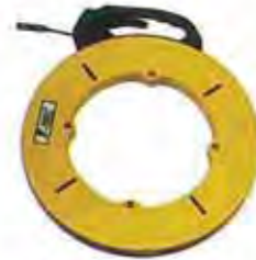
ฟิชเทปหุ้ม "FTC"