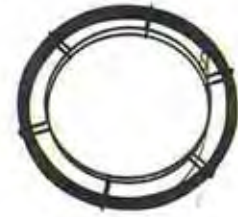
ฟิชเทปแบบม้วนล้อ "FT"