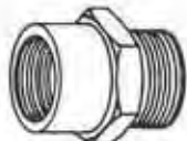
BODY ตัวข้อต่อ